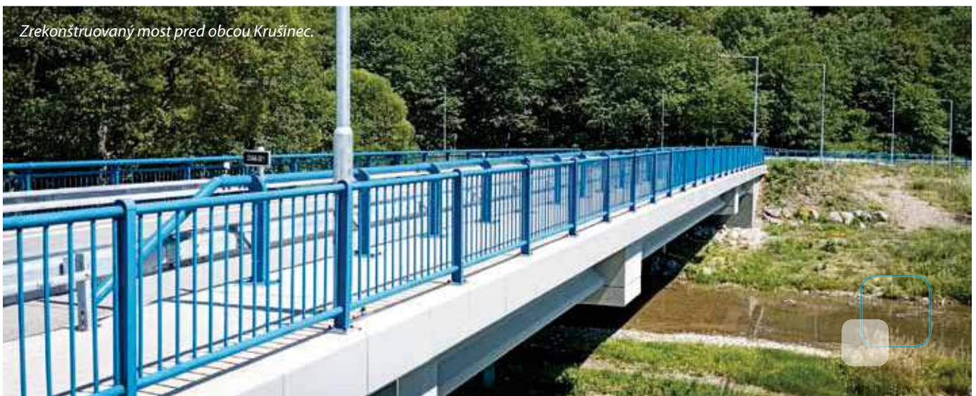
Zrekonštruovaný most pred obcou Krušíneec.

Aktuálne sú po úspešnej súťaži na dodávateľov odovzdané do realizácie už tri stavebné akcie v celkovej hodnote vyše 10,7 milióna eur. Pôjde o rekonštrukciu ciest a mostov na ceste II/ 537 v úsekoch Podbanské – Pavúčia Dolina, Tatranské Matliare – Križovatka s cestou I/66 a tiež elimináciu bezpečnostných rizík na mostoch a oporných múroch. Realizáciou týchto akcií, ktoré sú spolufinancované zo zdrojov EÚ prostredníctvom IROP, dôjde nielen k zlepšeniu plynulosti cestnej premávky, komfortu a bezpečnosti dopravy, ale aj k zatraktívneniu regiónu a zvýšeniu dopravnej mobility.