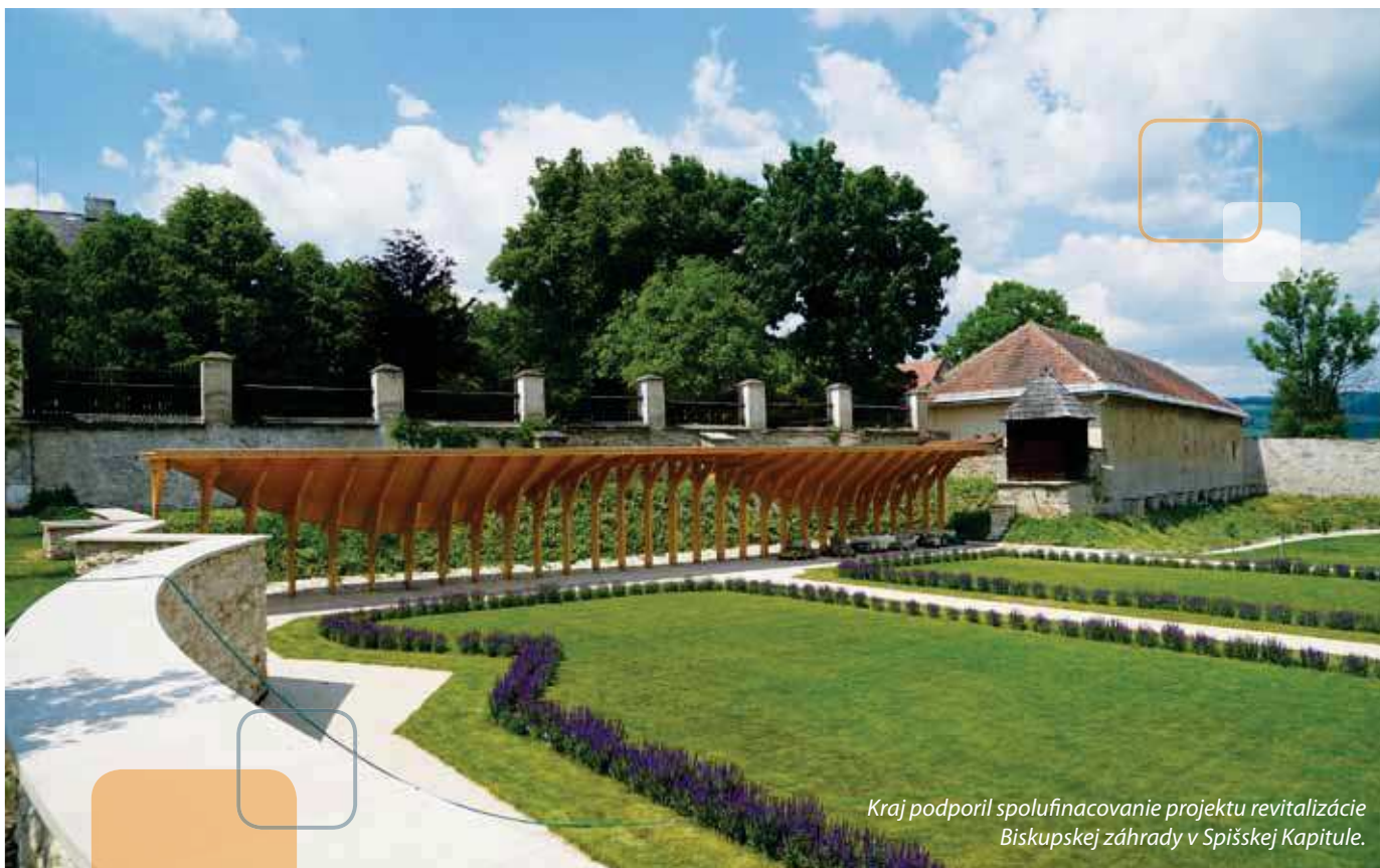
Kraj podporil spolufinancovanie projektu revitalizácie Biskupskej záhrady v Spišskej Kapitule.