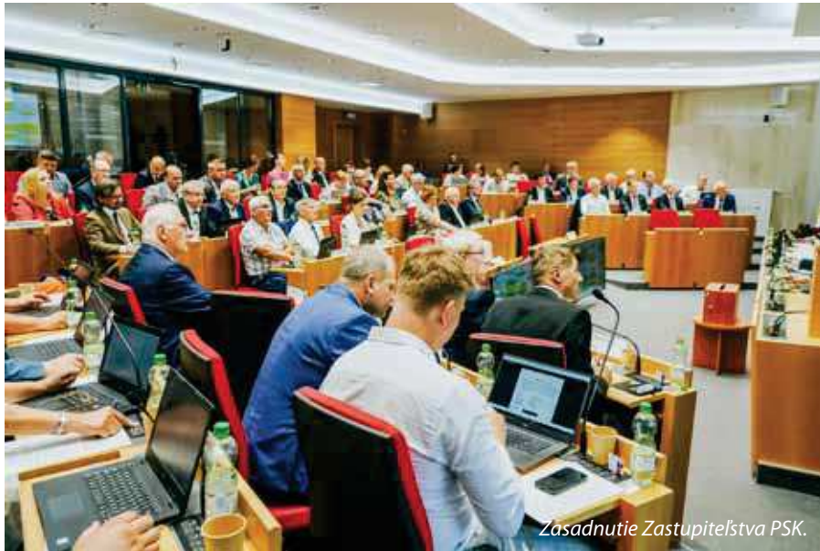
Zasadnutie Zastupiteľstva PSK.

V Sabinove by mal vzniknúť nový priemyselný park. Vláda poverila ministerstvo hospodárstva, aby zabezpečilo jeho prípravu do konca roka 2025. V prípade realizácie projektu by malo ísť o jeden z najväčších priemyselných parkov v našom kraji. Zastupiteľstvo PSK na svojom júnovom rokovaní už schválilo pozemky v okrese Sabinov, časť Orkucany na jeho výstavbu. A to spoločnosti MH Invest, s.r.o., zriade-