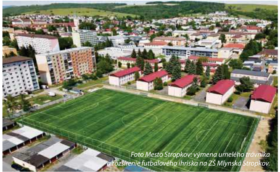
výmena umelého trávnik a rozšírenie futbalového ihriska na ZŠ Mlynská Stropkov.

Celkovo 3,85 milióna eur rozdelili krajskí poslanci v rámci Výzvy pre región na svojom júnovom zasadnutí. Z dôvodu vyššieho záujmu zo strany žiadateľov aj požadovanej dotácie sa krajský parlament rozhodol sumu navýšiť o 150-tisíc eur. Z 201 prijatých žiadostí napokon podporil 95 projektov.