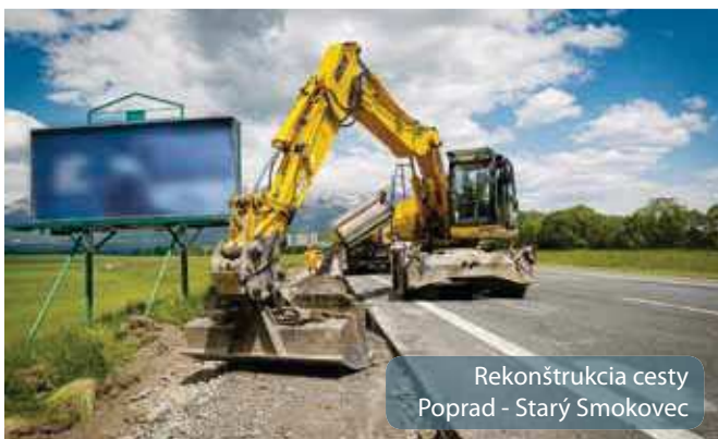
Rekonštrukcia cesty Poprad - Starý Smokovec

Pripravované sú aj projekty, pri ktorých sú už podané žiadosti na poskytnutie európskych fondov. Investičné akcie sa týkajú eliminácie bezpečnostných rizík v tatranskej oblasti na ceste II/537 v úsekoch Starý Smokovec, Tatranské Matliare, Pavúčia dolina, Batizovský potok po Starý Smokovec. Ide o rekonštrukcie 28 km ciest v hodnote spolu 25,3 mil. eur.