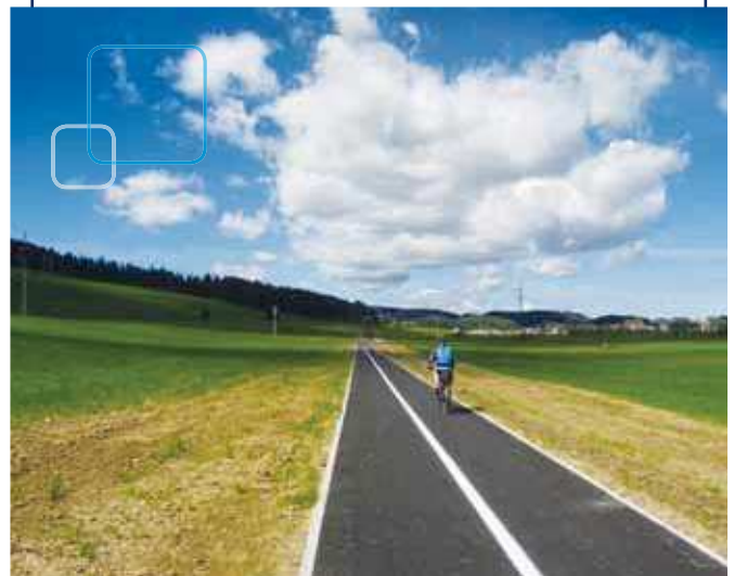
Výstavba cyklochodníka Lopusná – Lučivná v dĺžke 1,5 km s cyklistickou lávkou cez potok vďaka dotácii z Výzvy pre región vo výške 148 581 eur.

Do regiónov tento rok poputuje v dotáciách ďalších takmer 6,2 miliónov eur. Krajské peniaze znovu pomôžu budovať a modernizovať športoviská, cyklotrasy, opravovať kultúrne pamiatky, zveľaďovať pútnický turizmus, sociálnu oblasť. Nepriamo podporia oblasť zamestnanosti a podnikania v jednotlivých regiónoch, čím prispievajú k ich zveľadeniu a zatraktívneniu. Minulý rok bolo takto podporených 822 zmysluplných projektov. Vďaka aktuálne vyhláseným výzvam - Výzva poslancov PSK, Výzva predsedu PSK, Výzva pre región a Výzva Participatívny rozpočet k nim pribudnú stovky ďalších.