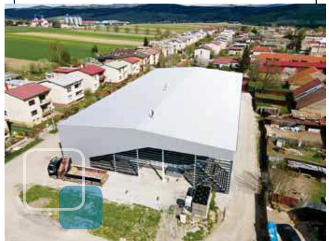
Dokončenie prestrešenia hokejovo-hokejbalovej haly v Spišskej Belej vďaka dotácii z Výzvy pre región vo výške 44 205 eur.