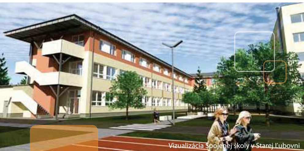
Vizualizácia Spojenej školy v Starej Ľubovni