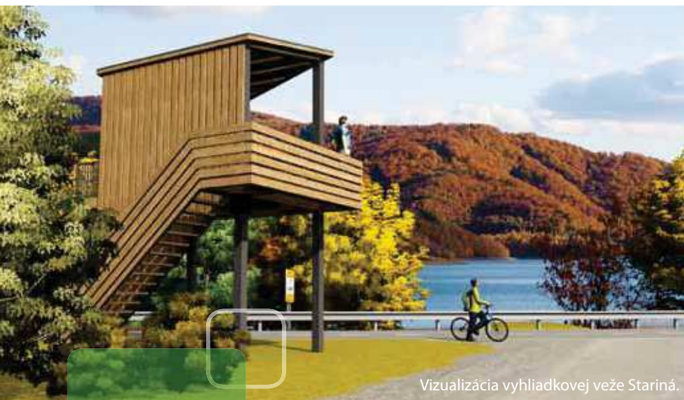
Vizualizácia vyhladkovej veže Stariná.