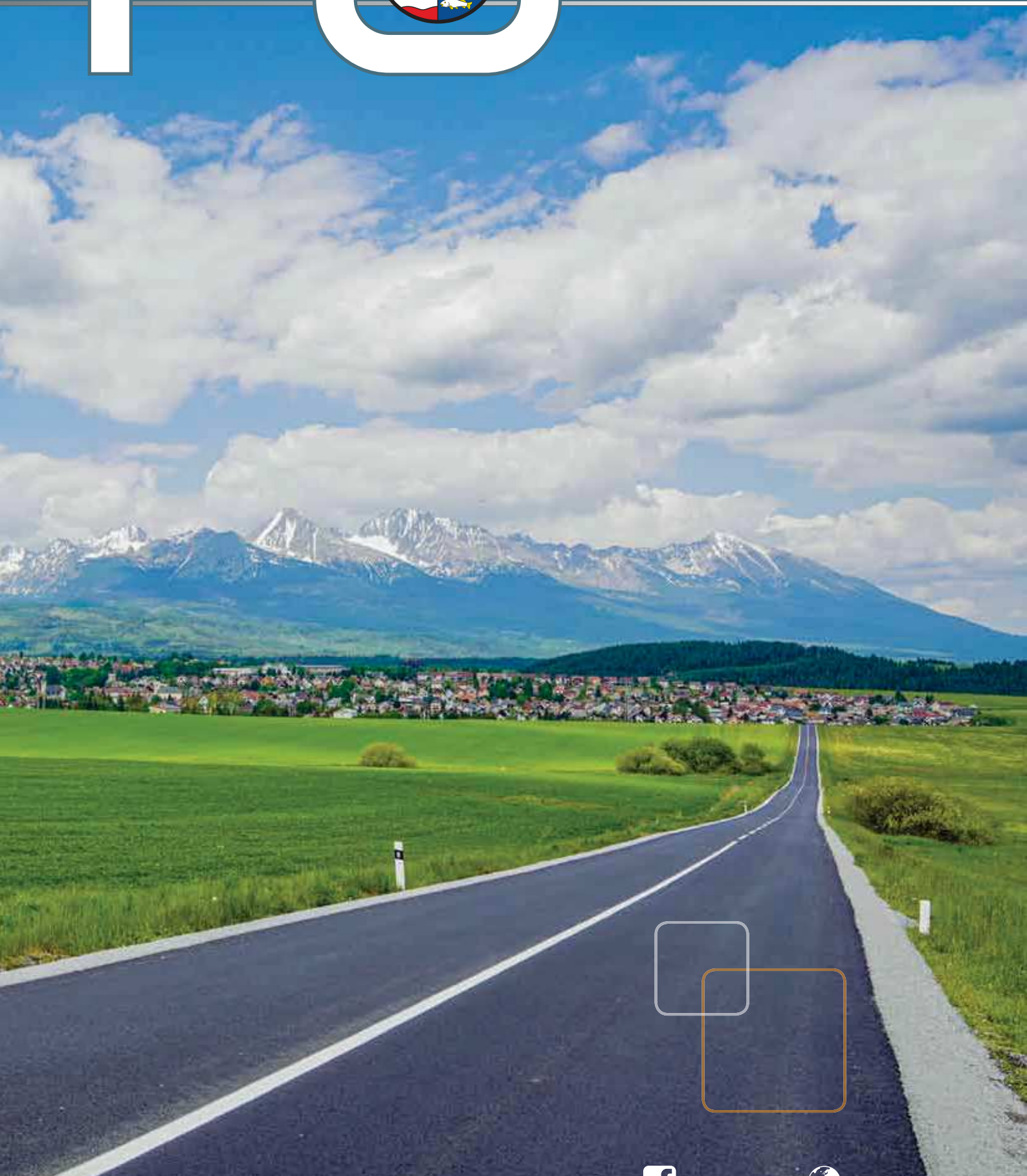
Pohľad na obnovený úsek cesty Štrba – Suňava.