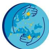
European Neighbourhood Policy

Sieť NEEBOR nadviazala na svoje stanovisko k cezhraničnému komponentu ENPI a rokovala so zástupcami DG AIDCO a DG DEVCO o aktuálnom vývoji prípravy tohto nástroja susedskej politiky EÚ. V rámci diskusie boli predstavené návrhy EK a otvorené problematické oblasti v procese implementácie. K danej téme odznel príspevok predstaviteľky DG DEVCO na výročnej konferencii NEEBOR. Vývoj v tejto oblasti je priebežne konzultovaný s Odborom cezhraničných programov PSK. Prvé rokovania medzi členskými štátmi a EK prebehli, negociácie sa prenášajú na úroveň programov. Slovensko bude mať oprávnené územie hraničiace s Ukrajinou opäť v programe štyroch krajín Maďarsko-Slovensko-Rumunsko-Ukrajina aj v období 2014-2020.