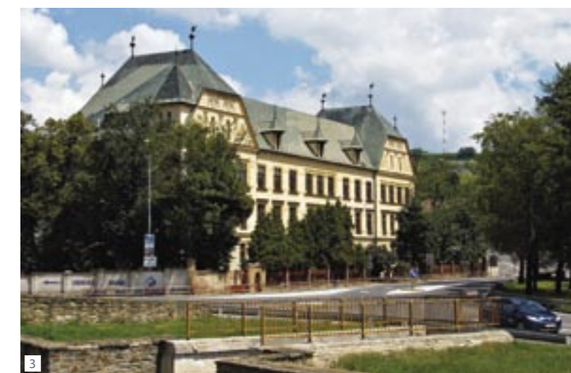
1. Brama Koszycka – wjazd do Lewoczy od wschodu. 2. Lewocza od zawsze była miastem o znaczeniu europejskim. 3. Budynek szkoły podstawowej.

Już sam wjazd do Lewoczy i widok olbrzymiego rynku otoczonego renesansowymi kamienicami udowadnia, że miasto to w średniowieczu miało znaczenie na skalę europejską. Dzięki układowi urbanistycznemu i murom obronnym Lewocza zachowała klimat średniowiecznego miasta. Dziś ma status miejskiego rezerwatu i dzięki licznym zabytkom i dziełom sztuki należy do najpiękniejszych miejsc na Słowacji.