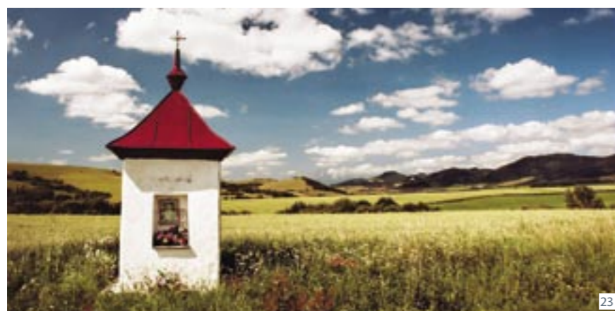
19. Kościół św. Mikołaja na rynku w Starej Lubowli. 20. Detal kościoła św. Mikołaja. 21. - 22. Wnętrze kościoła św. Mikołaja. 23. Widok na Zamagurze. 24. - 25. Wnętrze kamienicy lubowelskiej – ekspozycja stała.