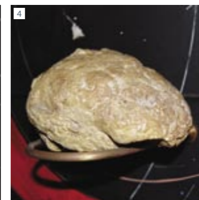
1. Rynek św. Idziego w Popradzie. 2. Kościół św. Idziego w Popradzie. 3. Podobizna i czaszka neandertalczyka. 4. Odlew mózgowcazki.