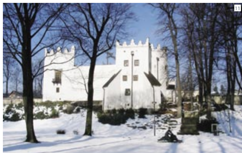
5. Ratusz. 6. Główny ołtarz kościoła artykularnego. 7. Wnętrze drewnianego kościoła artykularnego. 8. Nowy kościół ewangelicki. 9. Liceum ewangelickie. 10. Biblioteka liceum ewangelickiego. 11. Renesansowy kasztel Strażki z wystawą obrazów Ladislava Mednyanskiego. 12. Rzemiosło rymarskie. 13. Dziedziniec Zamku Kieżmarskiego podczas Festiwalu Rzemiosła Ludowego. 14. Producent pisco ze wsi Brutovce. 15. Produkcja form na oscypki. 16. Pokaz rzemiosła kowalskiego. 17. Tradycyjne dzwonki. 18. Stragan z ceramiką. 19 - 20. Muzeum Jozefa Maksymiliana Petzvala, Biała Spiska.