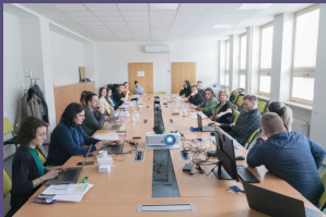
Krátke privítanie hostí a vzájomné predstavenie účastníkov.