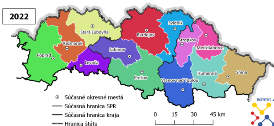
Mapa 3: Členenie Prešovského kraja na okresy