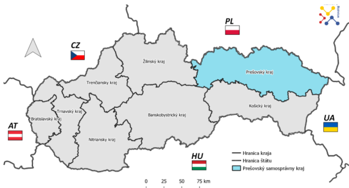
Mapa 1: Geografická poloha Prešovského kraja