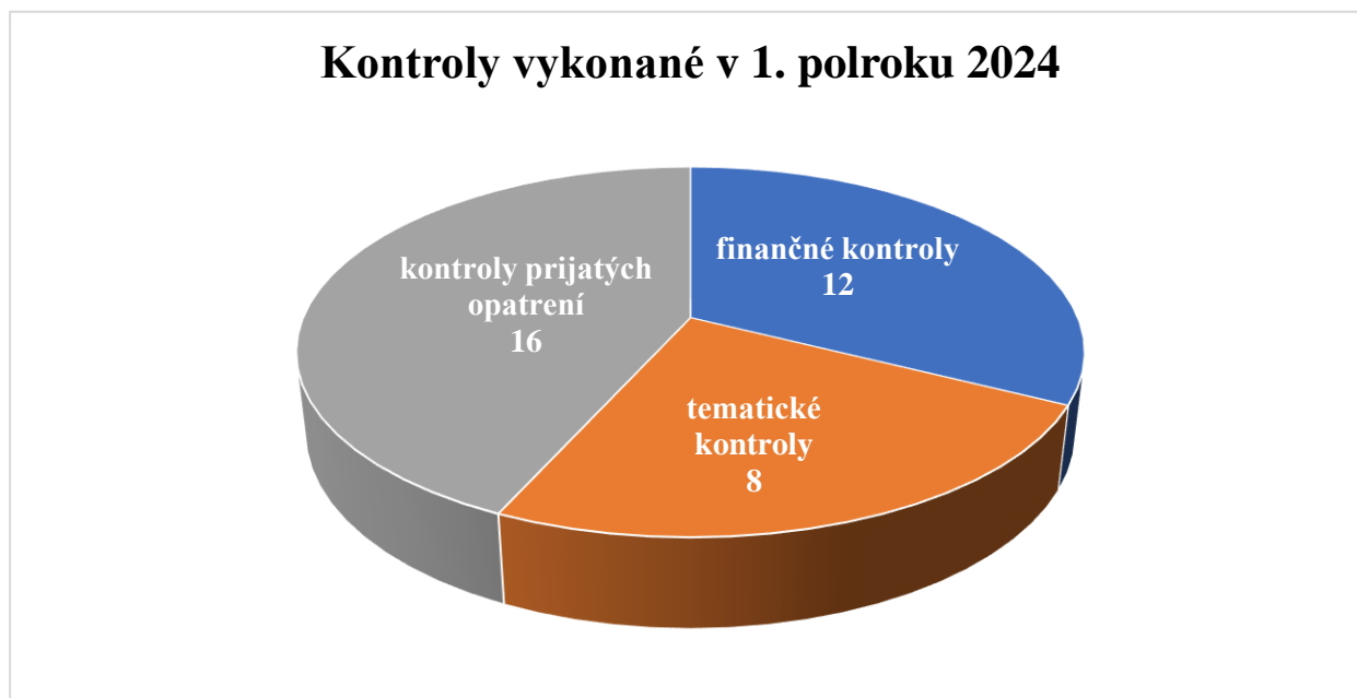
Graf č. 2