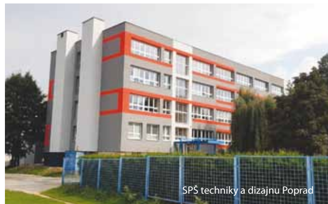
SPŠ techniky a dizajnu Poprad

Dôležitým prvkom efektivity školstva je jeho optimalizácia. Jej výsledkom je skvalitnenie výučby a materiálno-technického vybavenia škôl, lepšie platové ohodnotenie učiteľov, vyššia kvalita ponuky učebných a študijných odborov a efektívnejšie využitie finančných prostriedkov. Optimalizácia mení školy na kvalitné vzdelávacie inštitúcie moderné zvonku i zvnútra. S jasným efektom a pozitívnym výsledkom PSK zoptimalizoval niektoré školy v okresoch Prešov, Bardejov a Svidník.