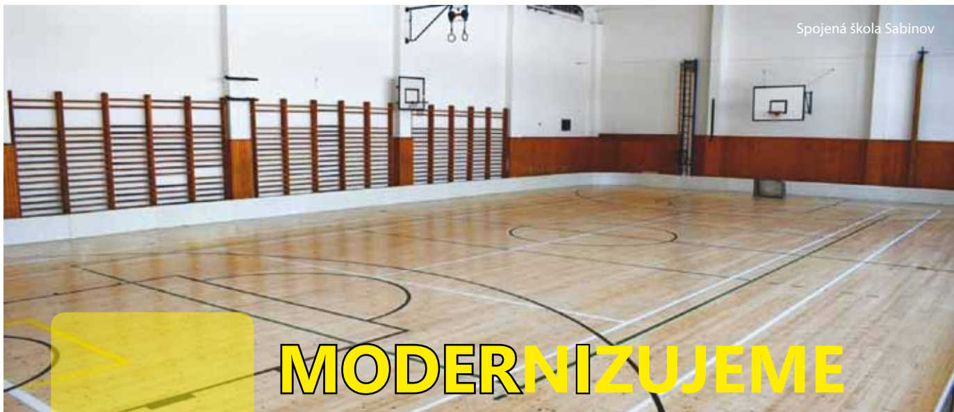
Spojená škola Sabinov