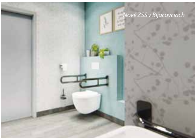
Nové ZSS v Bijacovciach