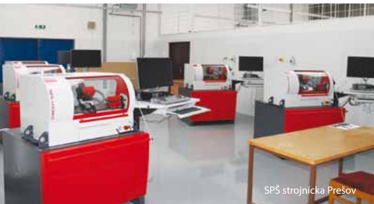
SPŠ strojnícka Prešov

sa modernizovali objekty v okresoch Prešov, Vranov nad Topľou, Poprad, Levoča, Bardejov, Humenné, Kežmarok a Svidník. Prešovský samosprávny kraj z vlastného rozpočtu na rekonštrukcie škôl a ich technické zabezpečenie v tomto roku zatiaľ vyčlenil takmer 4,4 miliónov eur.