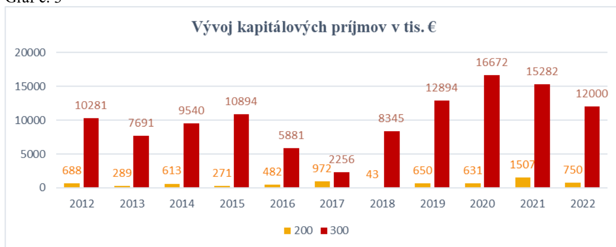
Graf č. 3

V rámci návrhu kapitálových grantov a transferov nie sú rozpočtované finančné prostriedky.